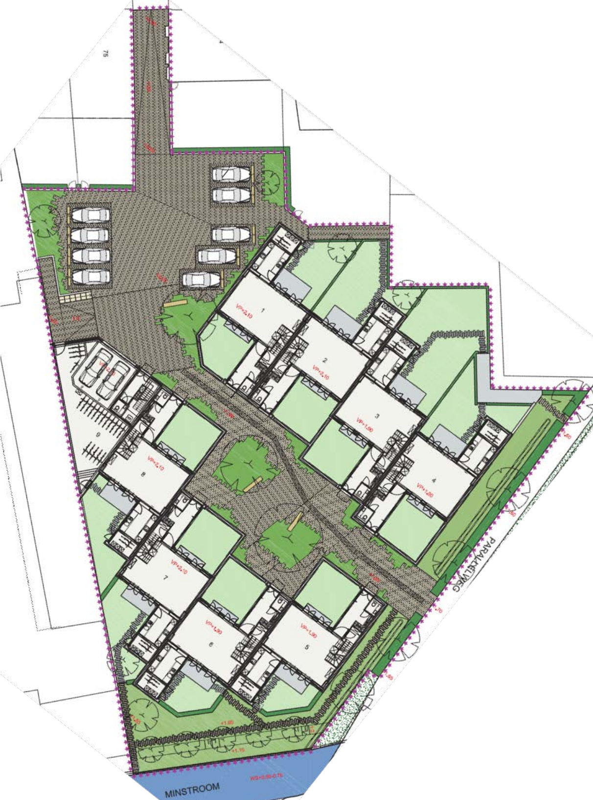
In bovenstaande figuur staat het planontwerp.